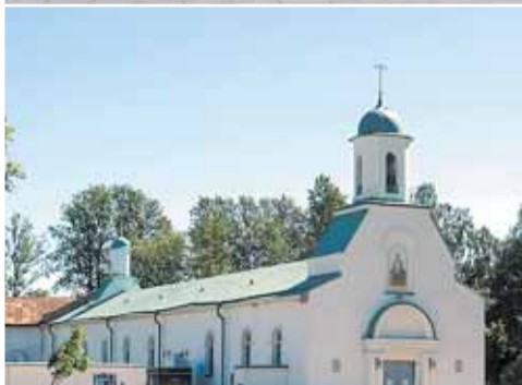
Подворье Свято-Троицкого Александра Свирского мужского монастыря