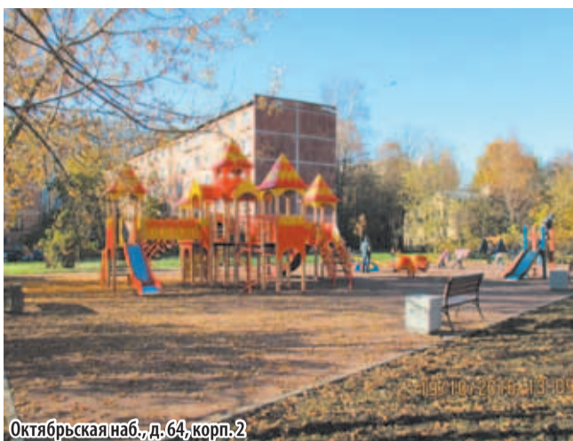
Октябрьская наб., д. 64, корп. 2