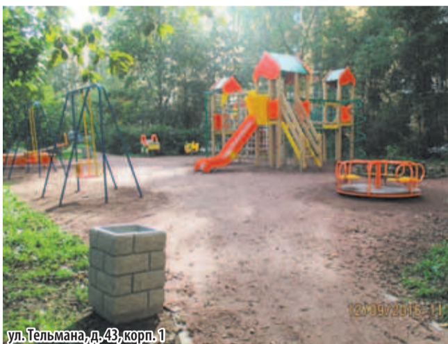
ул. Тельмана, д. 43, корп. 1