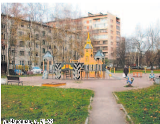
ул. Народная, д. 71-75

тельные скамейки вокруг «квадратной» зоны отдыха и цветочный вазон на «круглой» зоне отдыха. Мы планируем ис-