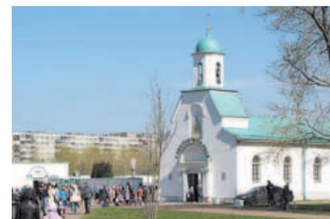
Подворье Свято-Троицкого Александра Свирского мужского монастыря

По территории МО МО Народный проходит 12 улиц, проспектов и переулков про-