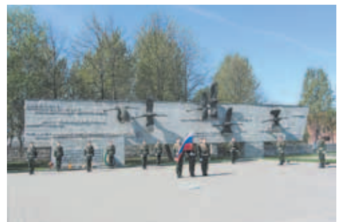
Невское воинское кладбище – мемориал «Журавли»

Численность населения на 1 января 2017 года составляет 64 059 человек.