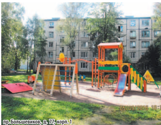
пр.Большевиков, д. 77, корп. 1

единённых между собой мощёной пешеходной дорожкой. В текущем году установим к уже установленным дополни-