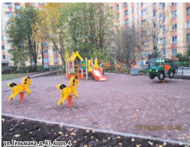
ул. Тельмана, д. 43, корп. 4