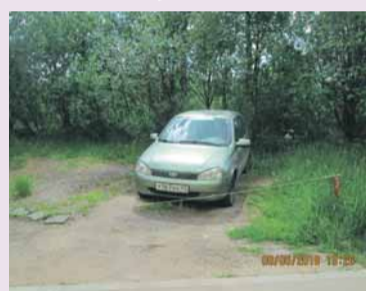
ул. Тельмана, д. 43, корп. 4 до реконструкции