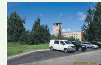
ул. Тельмана, д. 43, корп. 4 после реконструкции

Неухоженная и местами разрезанная территория, используемая автомобилистами в качестве несанкционированной парковки, была приведена в надлежащее состояние. В результате реализации программы были организованы дополнительные парковочные места с асфальтобетонным покрытием площадью 365,5 кв. м, установлен бортовой камень протяжённостью 96,6 погонных метров, восстановлено газонное покрытие общей площадью 96,7 кв. м.